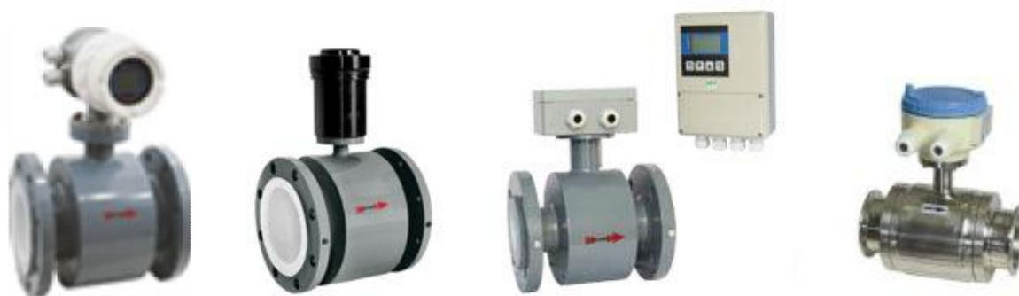
Рисунок 1 – Общий вид расходомеров-счетчиков электромагнитных «ЭНЕРГИЯ-Э»

Общий вид расходомеров-счетчиков электромагнитных «ЭНЕРГИЯ-Э» приведен на рисунке 1.