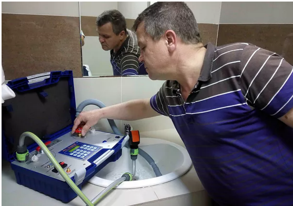
Демонстрация работы установки "ВПУ-Энерго М"